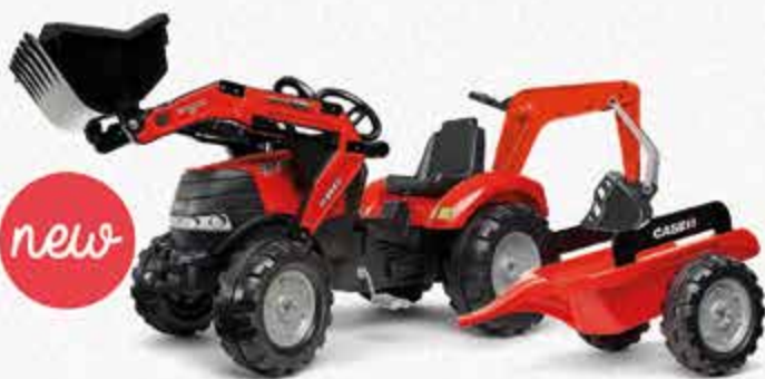
Case IH Puma 240 CVX | ref. 996V Ean code : 3016200001195