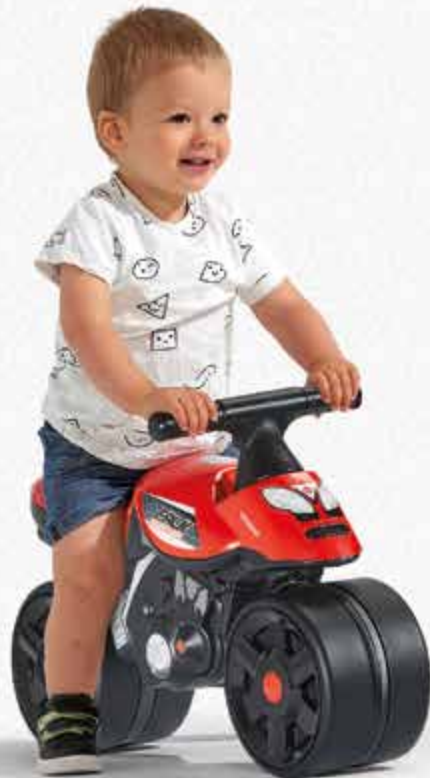
Baby Falk Racing Team moto ref. 400. Ean code : 3016200004004

62 x 25.5 x 39 cm 24.41 x 10.04 x 15.35 inches 2.4 kg 5.29 lbs 1-3 ans years 640 x 203 x 330 mm 25.2 x 7.97 x 12.99 inches 2.75 kg 6.07 lbs 43 dm 3 1.52 ft 3 Recycle score 40%