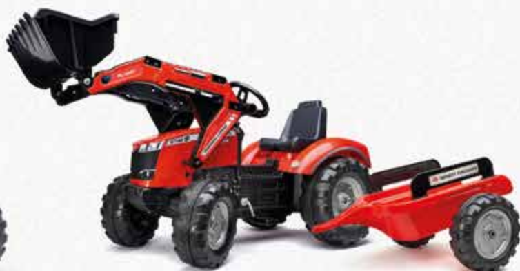
Massey Ferguson | ref. 4010AM Ean code : 3016204010148