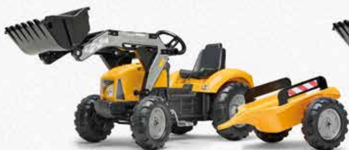
Super Builder backhoe-loader | ref. 2025AM Ean code : 3016202025144

192 x 53 x 66 cm 75.59 x 20.87 x 25.98 inches 18.10 kg 39.89 lbs 3-7 ans years 1028 x 503 x 528 mm 40.48 x 19.81 x 20.8 inches 15.05 kg 33.16 lbs 273 dm 3 9.64 ft 3