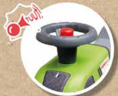
KLAXON MANUEL MANUAL HORN