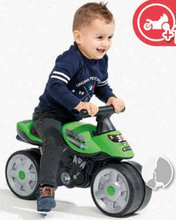
Bud Racing moto with whisper wheels ref. 402BRS. Ean code : 3016204022905

62 x 25.5 x 39 cm 24.41 x 10.04 x 15.35 inches 2.4 kg 5.29 lbs 1-3 ans years 640 x 203 x 330 mm 25.2 x 7.97 x 12.99 inches 2.75 kg 6.07 lbs 43 dm 3 1.52 ft 3 Recycle score 40%