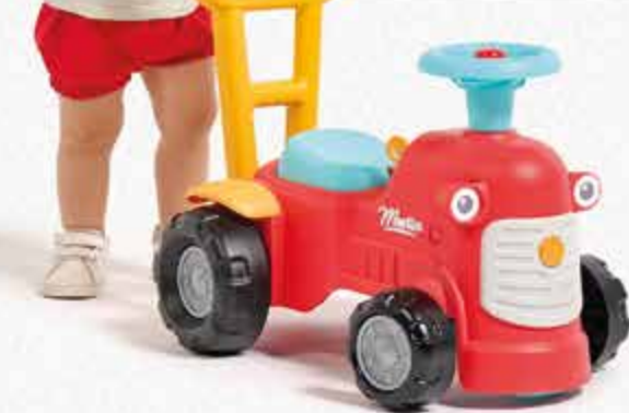
«Maurice» My first tractor | ref. 900 Ean code : 301620009009

57 x 31 x 45 cm 22.44 x 12.20 x 17.72 inches 2.30 kg 5.08 lbs 1-3 ans 3 ans 598 x 228 x 273 mm 23.54 x 8.98 x 10.75 inches 2.91 kg 6.42 lbs 37 dm 3 1.31 ft 3