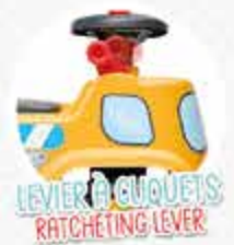
JCB ride-on with trailer and sand playset | ref. 715C Ean code : 3016200000648