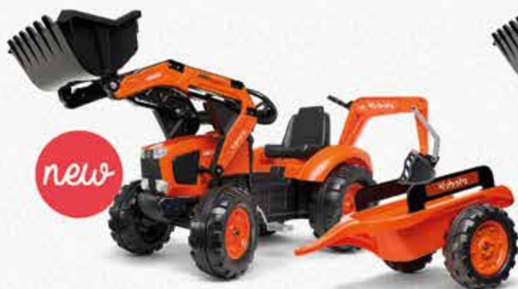
Kubota M6-142 | ref. 2060Y Ean code : 3016200001385