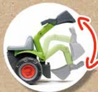
EXCAVATRICE ARRIÈRE REAR EXCAVATOR