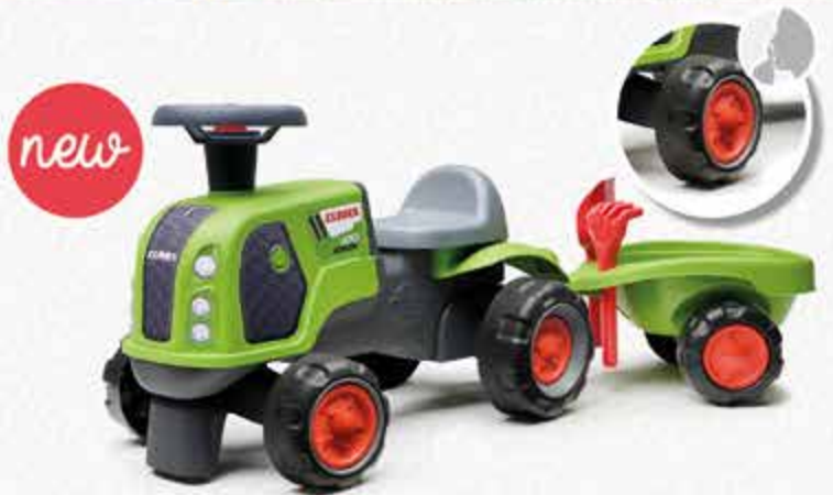
Baby Claas Arion 470 | ref. 312CS Ean code : 3016200001348