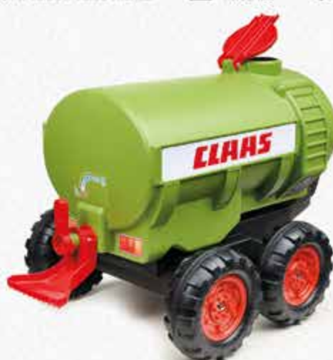
Claas Tanker | ref. 943C Ean code : 3016200000969