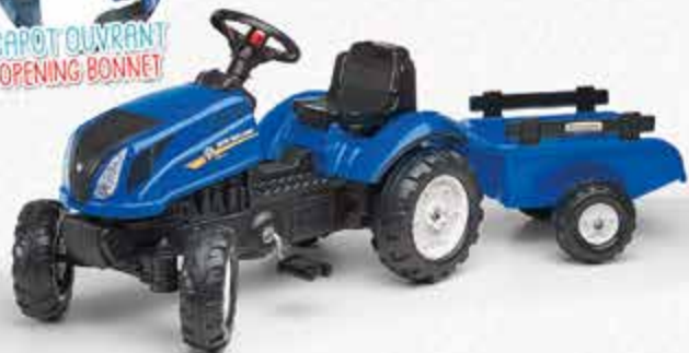
New Holland T6 | ref. 3080AB Ean code : 3016203080128