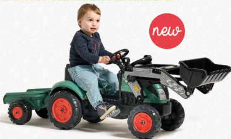
Farm Lander | ref. 2054L Ean code - 3016200000440

123 x 42 x 53 cm 48.43 x 16.54 x 20.87 inches 6.50 kg 14.34 lbs 2-5 ans years 608 x 388 x 358 mm 24.31 x 15.28 x 14.09 inches 7.26 kg 16.02 lbs 112 dm 3 3.96 ft 3