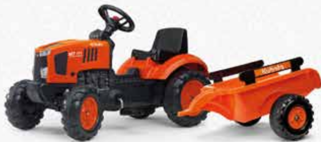
Kubota M7-174 | ref. 2065AB Ean code : 3016202065126