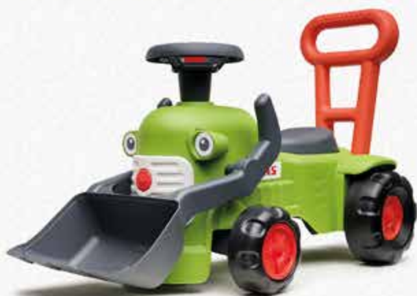
My first Claas tractor | ref. 912D Ean code : 3016200000808