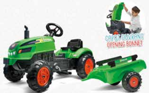
X-Tractor | ref. 2048AB Ean code : 3016202048129