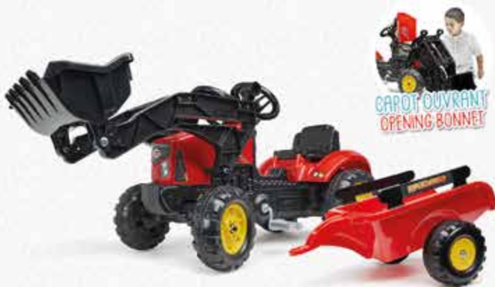
Supercharger | ref. 2030M Ean code - 3016202030131

162 x 42 x 53 cm 63.78 x 16.54 x 20.87 inches 7.35 kg 16.21 lbs 2-5 ans years 808 x 408 x 408 mm 31.81 x 16.06 x 16.06 inches 8.23 kg 18.13 lbs 135 dm 3 4.77 ft 3