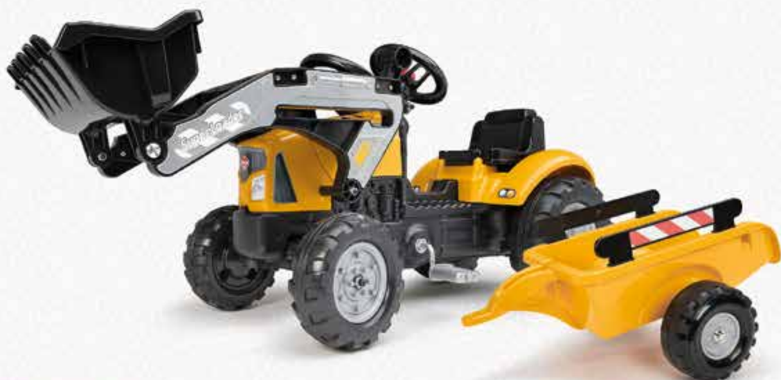
Super Builder | ref. 2035M Ean code : 3016202035135