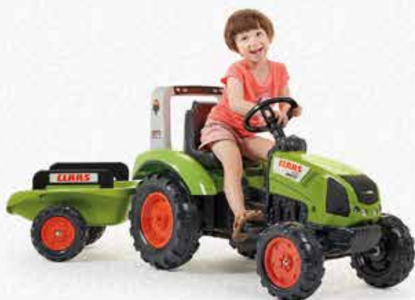
Claas Arion 430 | ref. 1040AB Ean code : 3016201040124