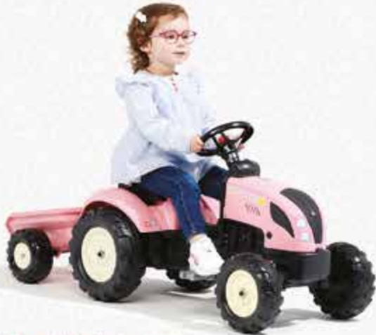
Country Star with trailer | ref. 2056L Ean code : 3016202056124