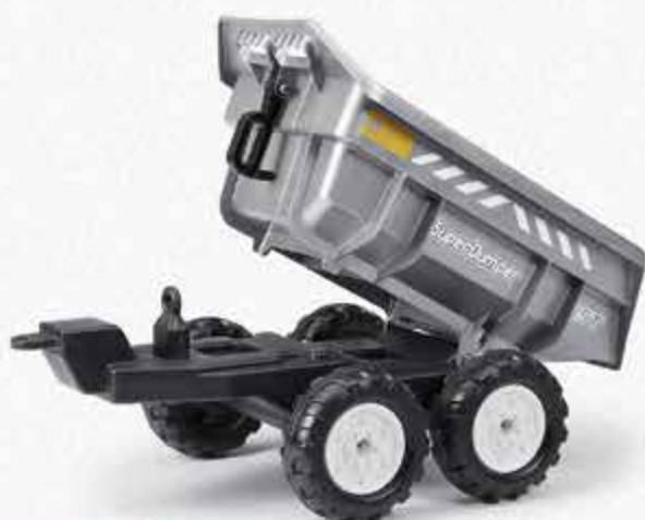
Super Dumper | ref. R-940C Ean code : 3016201894079