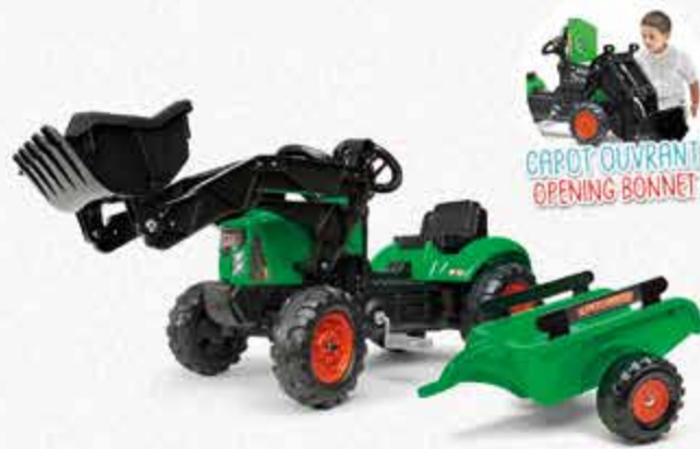
Supercharger | ref. 2031M Ean code - 3016202031148

162 x 42 x 53 cm 63.78 x 16.54 x 20.87 inches 7.35 kg 16.21 lbs 2-5 ans years 808 x 408 x 408 mm 31.81 x 16.06 x 16.06 inches 8.23 kg 18.13 lbs 135 dm 3 4.77 ft 3