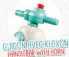
GUIDON AVEC KLAXON HANDLEBAR WITH HORN