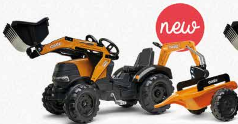
Case CE 580 Super N | ref. 997V Ean code : 3016200001198

206 x 59 x 70 cm 81.50 x 23.23 x 27.56 inches 16.50 kg 36.39 lbs 3-7 ans years 1132 x 512 x 572 mm 44.57 x 20.16 x 22.52 inches 19.00 kg 41.89 lbs 332 dm 3 11.72 ft 3