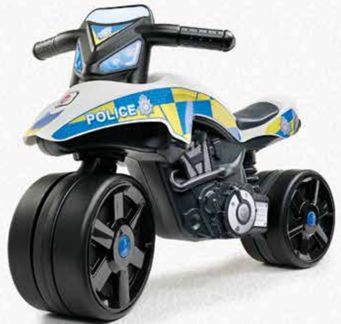
Falk Racing Team Motorcycle | ref. 547UK Ean code : 3016200006501