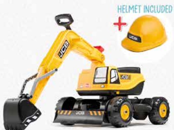
JCB wheeled excavator | ref. 155 Ean code : 3016200000570