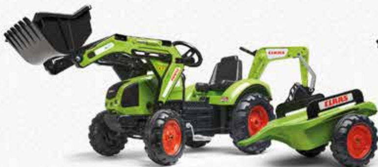
Claas Arion 430 | ref. 2070Y Ean code : 3016202070250