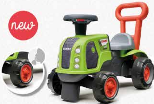
Baby Claas Arion 470 | ref. 312S Ean code : 3016200001317