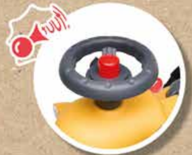
KLAXON MANUEL MANUAL HORN