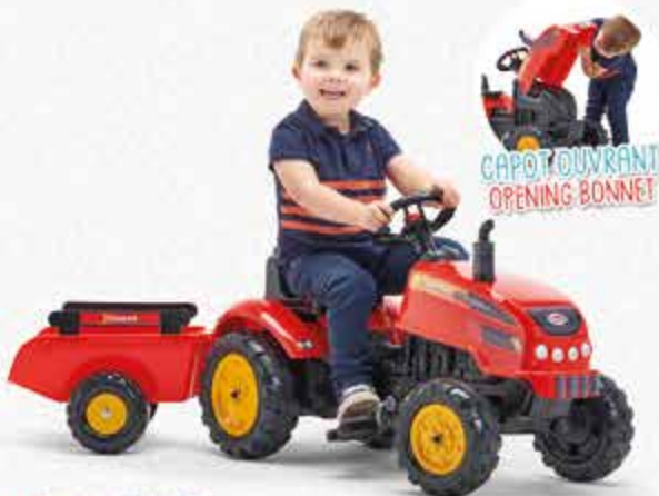
X-Tractor | ref. 2048AB Ean code : 3016202046125