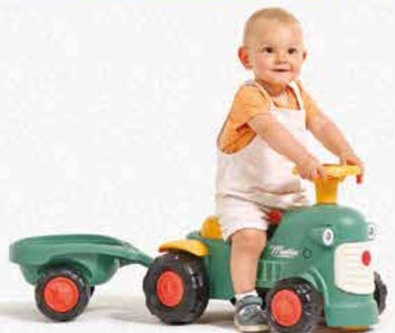
«Maurice» My first tractor with trailer | ref. 901C Ean code : 3016200090137

95 x 31 x 36 cm 37.4 x 12.2 x 14.17 inches 2.80 kg 6.18 lbs 1-3 ans 3 ans 598 x 273 x 338 mm 23.54 x 10.75 x 13.31 inches 3.61 kg 7.95 lbs 55 dm 3 1.94 ft 3