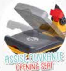
Volvo crawler excavator | ref. 141 Ean code : 3016200000853