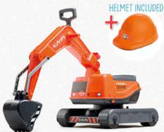
Kubota crawler excavator | ref. 142 Ean code : 3016200000549