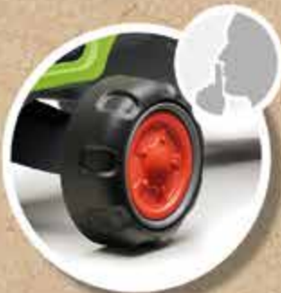
ROUES SILENCIEUSES WHISPER WHEELS