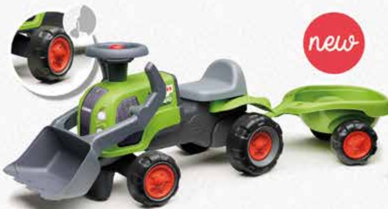
Baby Claas Arion 470 | ref. 312MS Ean code : 3016200001416