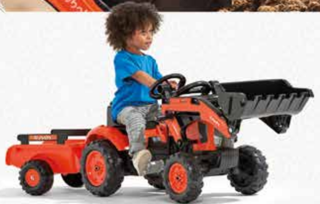
Kubota M7-174 | ref. 2065AM Ean code : 3016202065140