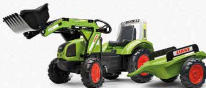
Claas Arion 430 | ref. 1040AM Ean code : 3016201040148