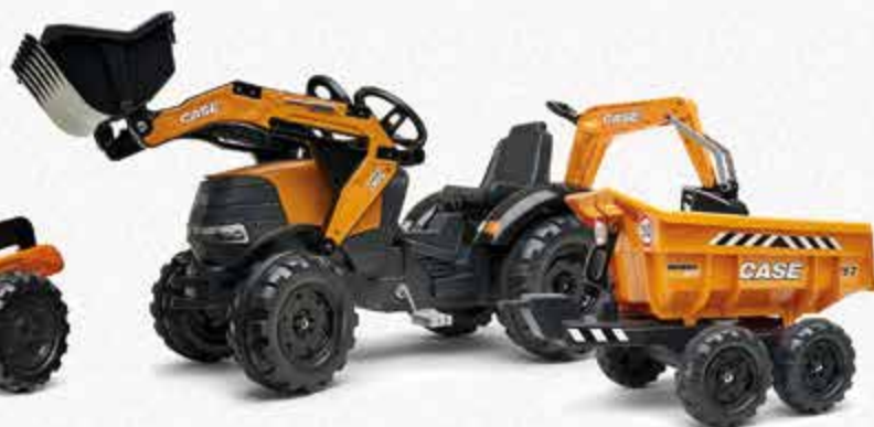
Case CE 580 Super N | ref. 997W Ean code : 3016200997252

225 x 59 x 80 cm 88.58 x 23.23 x 31.5 inches 19.00 kg 41.89 lbs 3-7 ans years 1132 x 512 x 572 mm 44.57 x 20.16 x 22.52 inches 21.50 kg 47.40 lbs 332 dm 3 11.72 ft 3