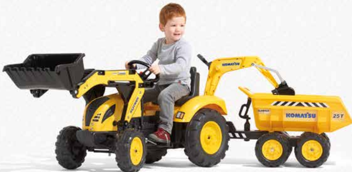
Komatsu backhoe-loader | ref. 2086W Ean code : 3016202086237