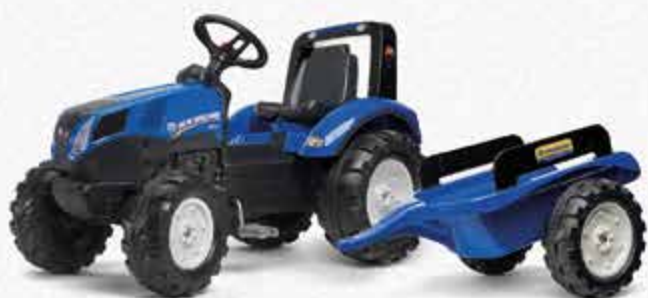
New Holland T8 | ref. 3090B Ean code : 3016200309024