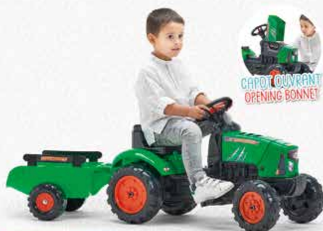
Supercharger | ref. 2031AB Ean code - 3016202031121

132 x 42 x 53 cm 51.97 x 16.54 x 20.87 inches 6.4 kg 14.11 lbs 2-5 ans years 808 x 388 x 358 mm 31.81 x 15.28 x 14.09 inches 7.16 kg 15.78 lbs 112 dm 3 3.96 ft 3