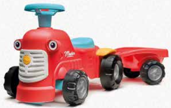
«Maurice» My first tractor with trailer | ref. 900C Ean code : 3016200090038

95 x 31 x 36 cm 37.4 x 12.2 x 14.17 inches 2.80 kg 6.18 lbs 1-3 ans 3 ans 598 x 273 x 338 mm 23.54 x 10.75 x 13.31 inches 3.61 kg 7.95 lbs 55 dm 3 1.94 ft 3