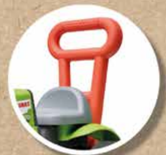
AIDE À LA MARCHÉ WALKING AID HANDLE