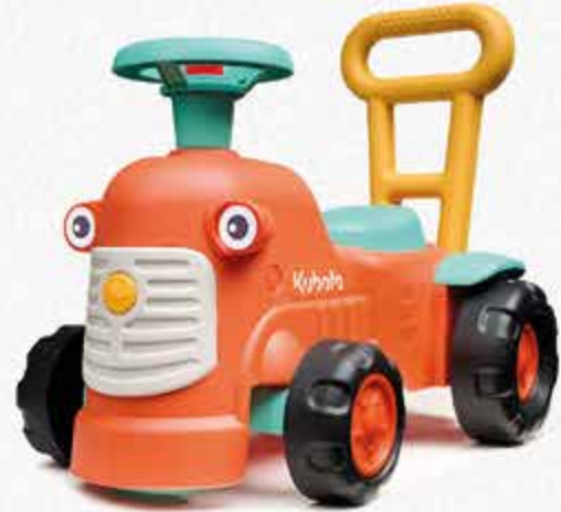
My first Kubota tractor | ref. 960 Ean code : 301620000839