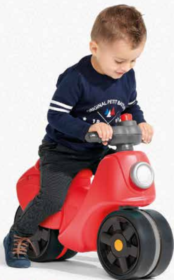
Strada Scooter | ref. 803 Ean code: 301620008033

59 x 24 x 48 cm 23.23 x 9.45 x 18.9 inches 550 x 205 x 310 mm 21.67 x 8.09 x 12.22 inches