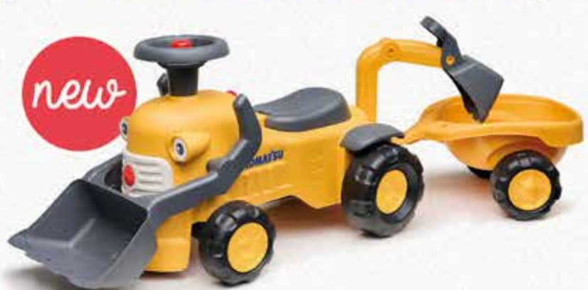
My 1st Komatsu backhoe loader| ref. 916D Ean code : 3016200001232