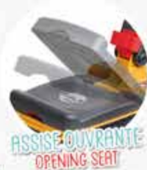
Volvo crawler excavator | ref. 151 Ean code : 3016200000860