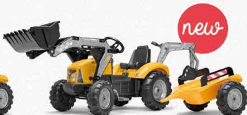
Super Builder backhoe-loader | ref. 2025Y Ean code : 3016200000716

203 x 53 x 70 cm 79.92 x 20.87 x 27.56 inches 15.50 kg 34.17 lbs 3-7 ans years 1028 x 503 x 528 mm 40.48 x 19.81 x 20.80 inches 17.45 kg 38.46 lbs 307 dm 3 10.84 ft 3