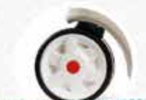
ROUES SILENCIEUSES WHISPER WHEELS