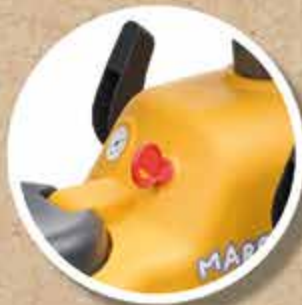
CLÉ SONORE CLICKING KEY