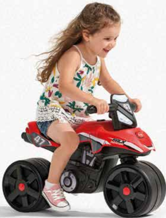
Falk Racing Team Motorcycle | ref. 540 Ean code : 3016200005407