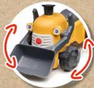
ROUES DIRECTIONNELLES STEERING WHEELS