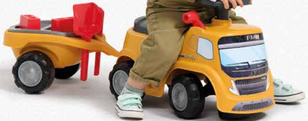
Volvo ride-on with trailer and sand playset | ref. 711C Ean code : 3016200000709