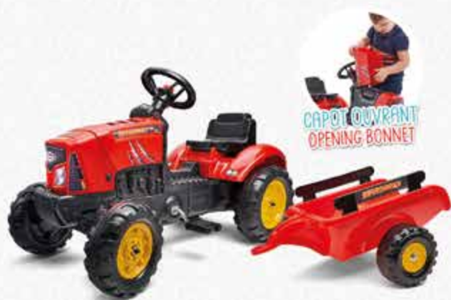
Supercharger | ref. 2030AB Ean code - 3016202030124

132 x 42 x 53 cm 51.97 x 16.54 x 20.87 inches 6.4 kg 14.11 lbs 2-5 ans years 808 x 388 x 358 mm 31.81 x 15.28 x 14.09 inches 7.16 kg 15.78 lbs 112 dm 3 3.96 ft 3