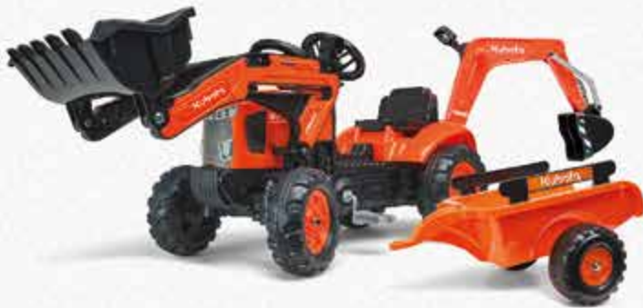
Kubota M7-174 | ref. 2065N Ean code : 3016200206552