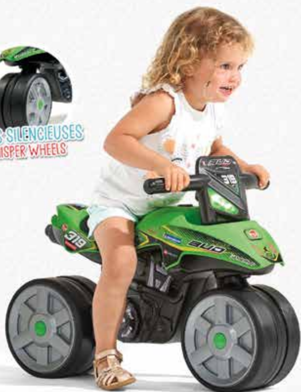
Bud Racing Motorcycle | ref. 502BR Ean code : 3016200502296