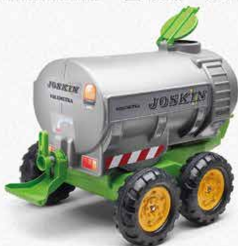
Joskin Volumetra Tanker | ref. 943JK Ean code : 3016200943129