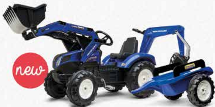
New Holland T8 | ref. 3090V Ean code : 3016200001362