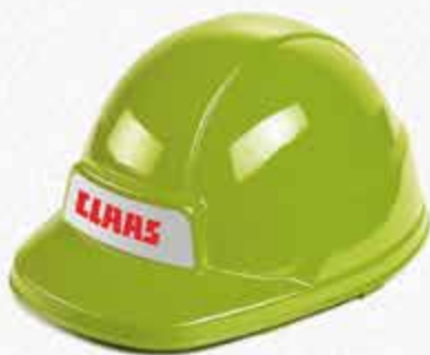
Claas helmet | ref. C-341C Ean code : 3016200334132