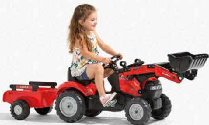
Case IH Maxxum 130 CVX | ref. 961AM Ean code : 3016209611135