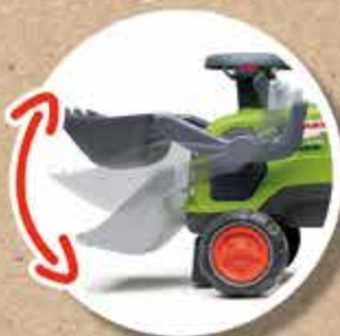
PELLE FRONTALE FRONT LOADER