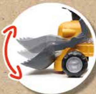
PELLE FRONTALE FRONT LOADER