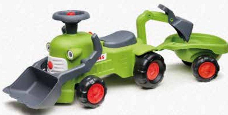
My first Claas tractor | ref. 912N Ean code : 3016200000815