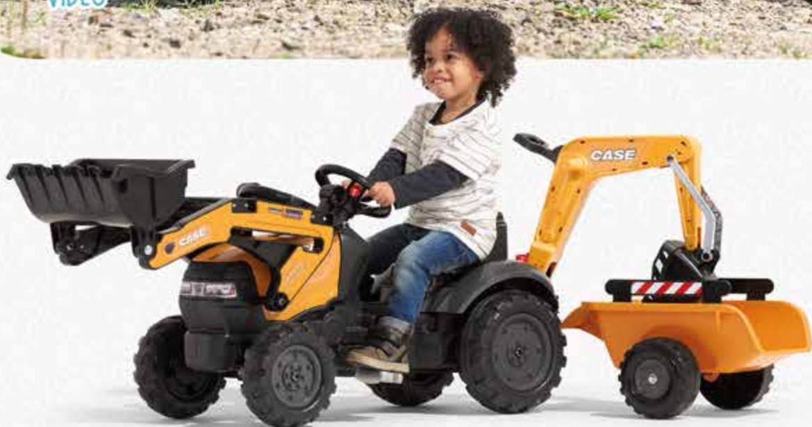
Case CE 580 Super N | ref. 967N Ean code : 3016200967149