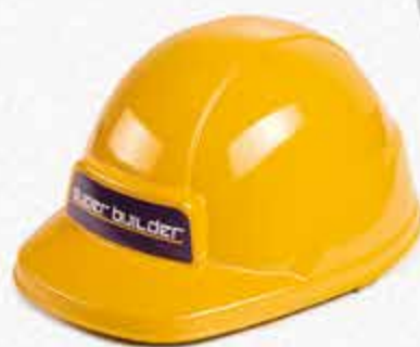
Super Builder helmet | ref. C-341TP Ean code : 3016203341274