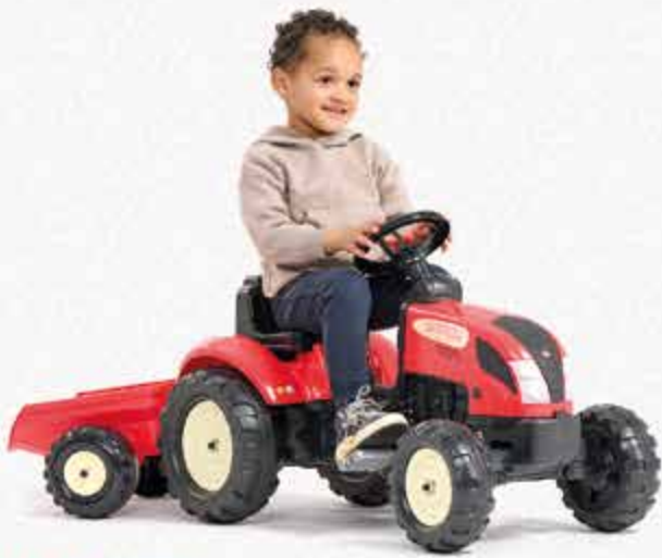
Kiddy Farm | ref. 2158L Ean code : 301620001096