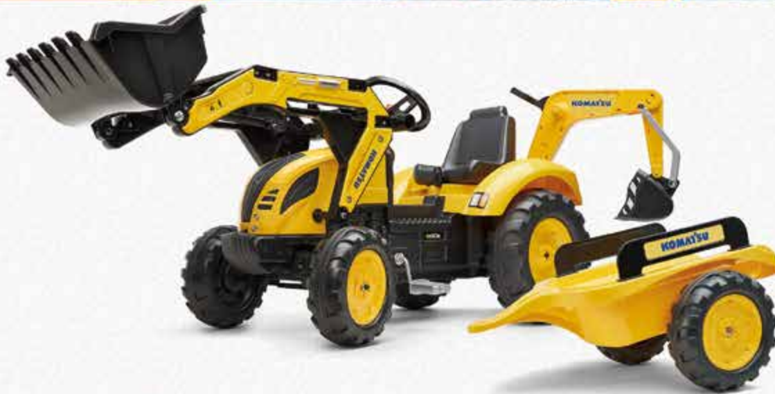
Komatsu backhoe-loader | ref. 2086V Ean code : 3016202086251