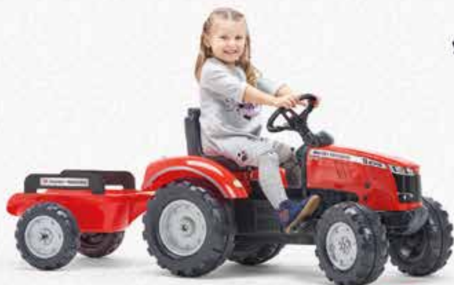
Massey Ferguson | ref. 4010AB Ean code : 3016204010124