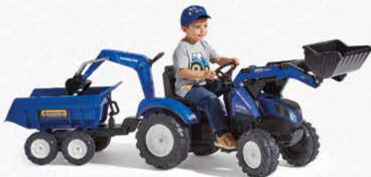
New Holland T8 | ref. 3080W Ean code : 3016203090233