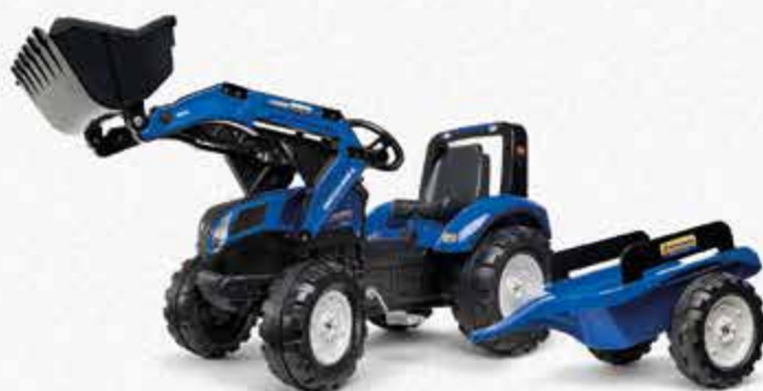
New Holland T8 | ref. 3090M Ean code : 3016203090134