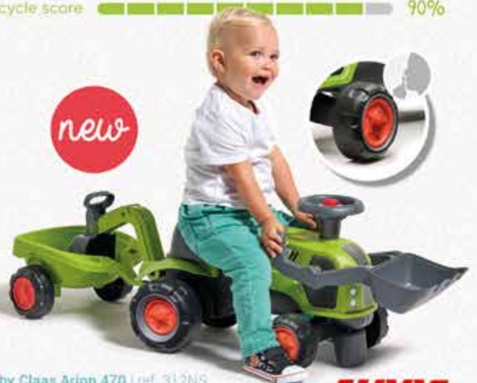
Baby Claas Arion 470 | ref. 312NS Ean code : 3016200001324