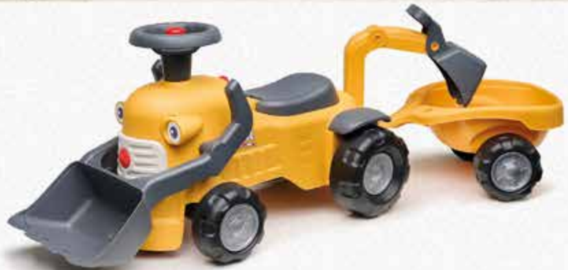
«Marcel» my 1st backhoe loader| ref. 910D Ean code : 3016200000655

72 x 31 x 45 cm 28.34 x 12.2 x 17.72 inches 2.30 kg 5.08 lbs 1-3 ans years 598 x 273 x 338 mm 23.54 x 10.75 x 13.31 inches 2.91 kg 6.42 lbs 55 dm 3 1.94 ft 3