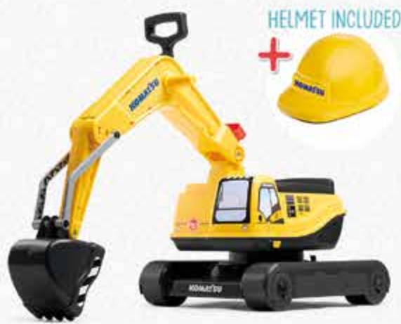
Komatsu crawler excavator | ref. 146 Ean code : 3016200000556