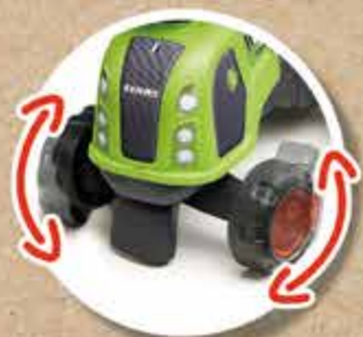
ROUES DIRECTIONNELLES STEERING WHEELS