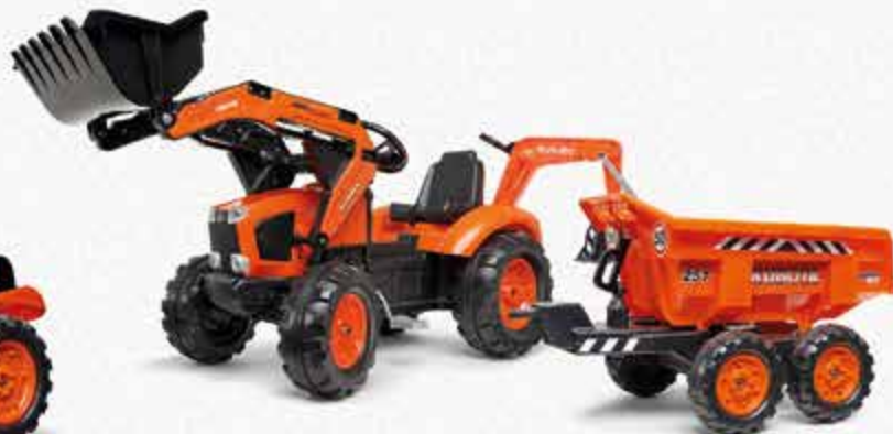
Kubota M6-142 | ref. 2090W Ean code : 3016202090234