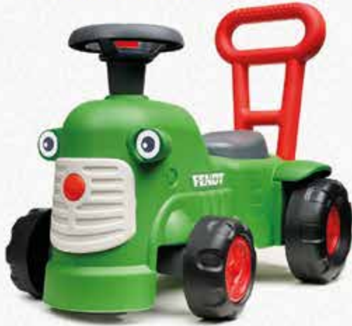
My first Fendt tractor | ref. 942 Ean code : 301620000921