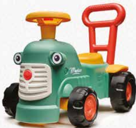
«Maurice» My first tractor | ref. 901 Ean code : 301620009016

57 x 31 x 45 cm 22.44 x 12.20 x 17.72 inches 2.30 kg 5.08 lbs 1-3 ans 3 ans 598 x 228 x 273 mm 23.54 x 8.98 x 10.75 inches 2.91 kg 6.42 lbs 37 dm 3 1.31 ft 3