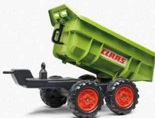
Super Dumper | ref. R-940C Ean code : 3016200094036