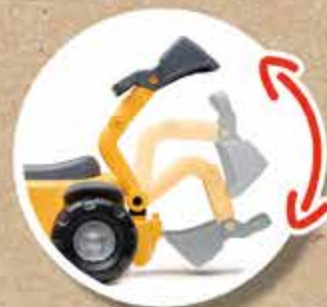
EXCAVATRICE ARRIÈRE REAR EXCAVATOR