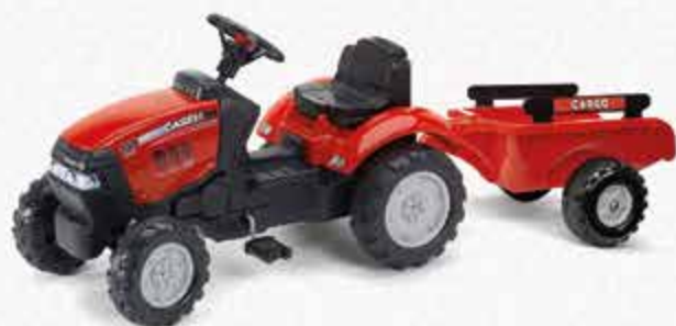
Case IH Maxxum 130 CVX | ref. 961B Ean code : 3016200096122