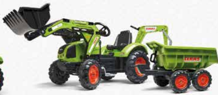
Claas Arion 430 | ref. 2070W Ean code : 3016202070236