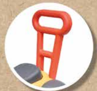
AIDE À LA MARCHÉ WALKING AID HANDLE