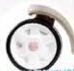
ROUES SILENCIEUSES WHISPER WHEELS