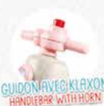
GUIDON AVEC KLAXON HANDLEBAR WITH HORN