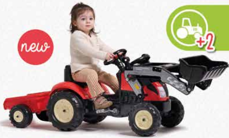
Kiddy Farm | ref. 2158Ml Ean code : 3016200001379