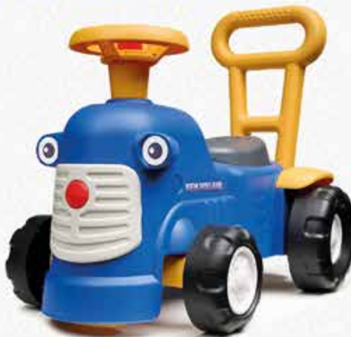
My first New Holland tractor | ref. 980 Ean code : 301620000846