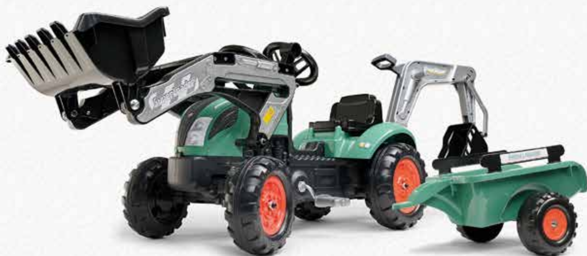
Farm Lander | ref. 2054N Ean code - 3016200000518

171 x 42 x 62 cm 67.32 x 16.54 x 24.41 inches 808 x 408 x 408 mm 31.81 x 16.06 x 16.06 inches 9.5 kg 20.95 lbs 10.38 kg 22.87 lbs 135 dm 3 4.77 ft 3 2-5 ans years